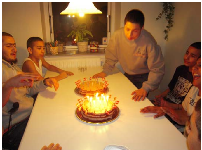
Kagen laves, beundres og lysene blæses ud.