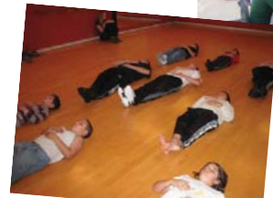
Et stille øjeblik i Tækwondo undervisningen