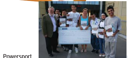
Powersport fik Greve Kommunes frivillighedspris i 2009. Det klarede de helt selv. Men vi er glade for at kunne støtte dem.