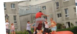
Indvielse af hoppepude i juni 2009