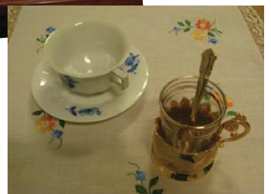
Tværkulturel Dialog arrangerede "Den levende historie" i Hundige StorCenter i september 2009