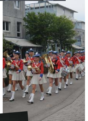
Greve Pigegarde gik i maj gennem Askerød, Gudekvarter- erne og Klyngen som del af en fest, der satte punktum for naboSKab- sundersøgelsen